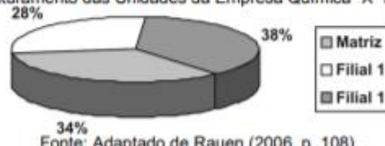
Gráfico 1 - Faturamento das Unidades da Empresa Química "X" no ano de 1998