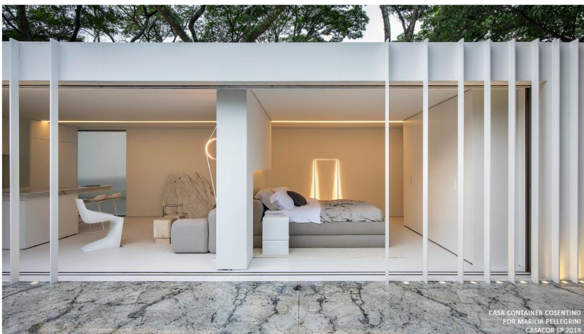
CASA CONTAINER COSENTINO POR MARILIA PELLEGRINI CASACOR SP 2019