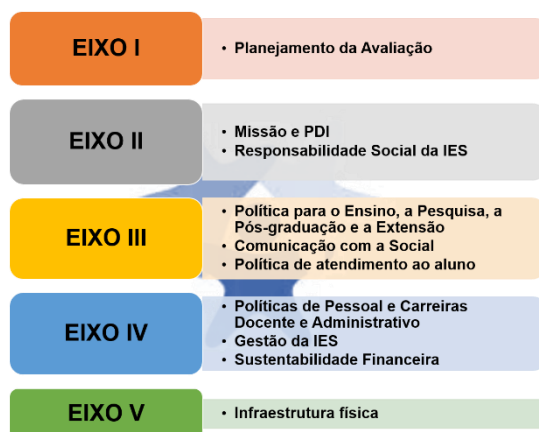
Figura 1 Dimensões do SINAES

Desta forma, os eixos de avaliação englobarão as dimensões conforme mostrado na figura a seguir.