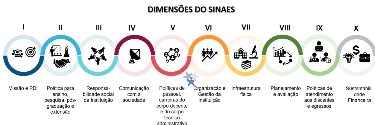
Figura 2 Dimensões do SINAES

A IES desenvolve um processo avaliativo que se baseia na escuta ativa de todos os setores envolvidos com a instituição na qual todos avaliam e são avaliados (direta ou indiretamente). Os processos de avaliação conduzidos pela CPA subsidiam os atos regulatórios institucionais e de cursos, bem como o desenvolvimento da instituição, sendo de competência e responsabilidade da CPA elaborar, a partir dos resultados apurados, o relatório de Autoavaliação pautado nas 10 dimensões que constam no SINAES conforme ilustrado abaixo.